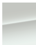
Белое облако (240*)